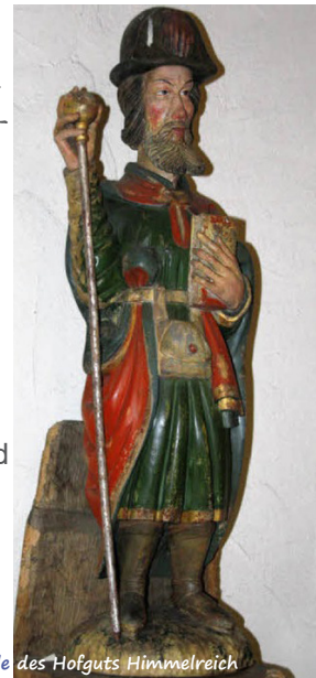
St. Jakobus in der Kapelle des Hofguts Himmelreich

Himmlicher Vater, ich mache mich auf den Weg. Was wird mir begegnen? Du, Gott, gehst mit mir. Darauf will ich vertrauen in Licht und Dunkelheit. Lass mich hören, was du mir zu sagen hast.